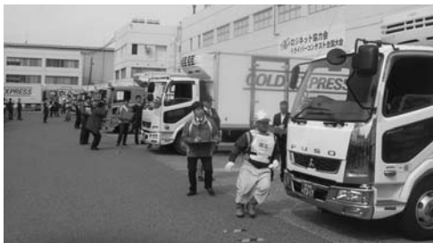
引合第一と高級技術者も活躍する

ニチレイロジグループのトラックドライバーは、安全確保と物流品質の向上を目的に、日々新たな創造を追求しています。今年度は、安全確保と物流品質の向上を目的に、ドライバーのスキルアップを図ります。また、安全確保と物流品質の向上を目的に、ドライバーのスキルアップを図ります。